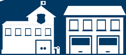
پولیس اور آگ سے تحفظ

مردم شماری آسان، محفوظ ہے اور اسے مکمل کرنے میں لگ بھگ 10 منٹوں کا وقت لگتا ہے۔ یہ بات جاننا ضروری ہے کہ آپ جو معلومات فراہم کرتے ہیں وہ قانون کے تحت تحفظ یافتہ ہیں اور نام کے ذریعہ اس کا اشتراک دوسروں کے ساتھ نہیں کیا جاسکتا جن میں ویلفیئر ایجنسیاں، امیگریشن اینڈ نیچرلائزیشن سروس، انٹرنل ریونیو سروس، عدالتیں، پولیس اور ملٹری شامل ہیں۔ مزید معلومات اور سوالنامہ کے نمونہ کی کاپی دیکھنے کے لیے، http://bit.ly/SchaumburgCounts پر شامبرگ گاؤں کی ویب سائٹ یا www.census.gov پر یو ایس مردم شماری بیورو کی ویب سائٹ ملاحظہ کریں۔ شامبرگ کے ہر افراد کی شماری کو یقینی بنانے کے لیے شکریہ!